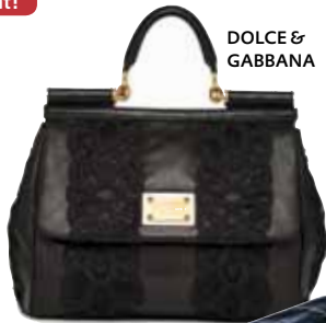
DOLCE & GABBANA