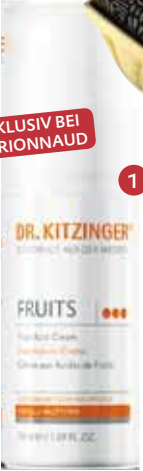
DR. KITZINGER FRUITS